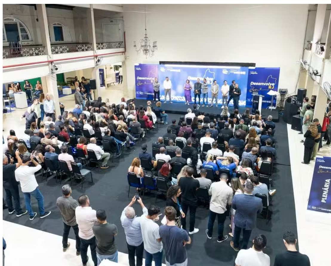
Desenvolve RJ percorre Magé, Angra dos Reis e Três Rios e fortalece debates sobre economia regional

O Desenvolve RJ promoveu edições estratégicas em Macaé, Angra dos Reis e Três Rios, reunindo empresários, empreendedores e lideranças para debater o fortalecimento da economia regional. Os encontros tiveram como foco discutir desenvolvimento econômico, inovação, ambiente de negócios e oportunidades de crescimento, considerando as vocações específicas de cada município. A programação contou com painéis e debates sobre temas estratégicos como acesso a crédito, incentivos fiscais, empreendedorismo e novas perspectivas para a indústria. Os estandes também tiveram grande movimentação, com empresários buscando soluções práticas e conexões. Participaram representantes da AgeRio, da Companhia de Desenvolvimento Industrial do Estado do Rio de Janeiro e de entidades empresariais, que apresentaram iniciativas voltadas ao aumento da competitividade.