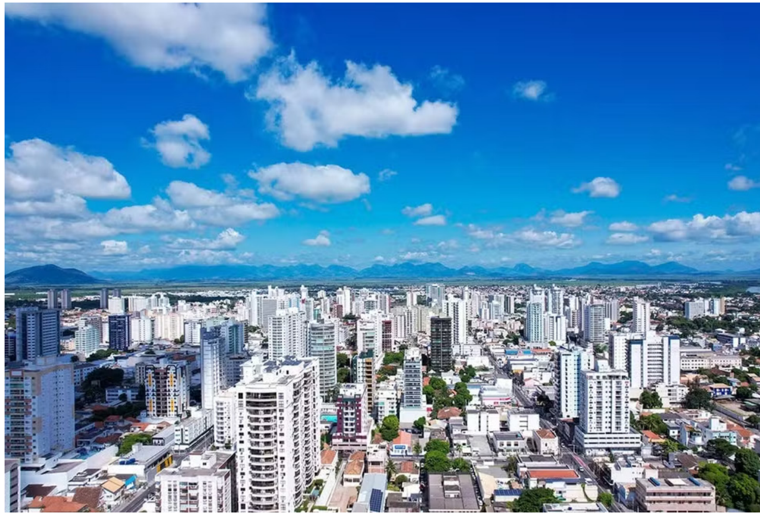
Municípios do Norte Fluminense recebem R$ 230 milhões em royalties

A liberação dos recursos ocorre após uma reclassificação envolvendo operações no Porto do Açu,